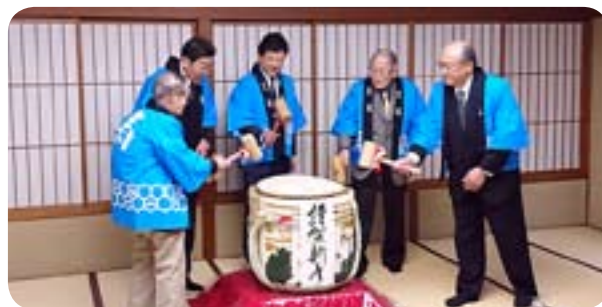
顧問・役員・OBによる鏡割り